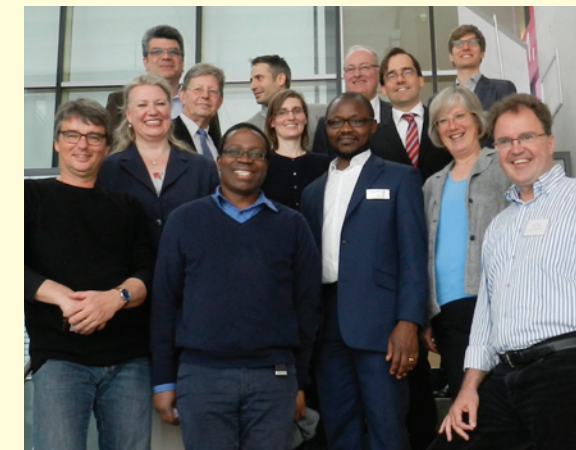
Mitglieder des REZ an der Landeskonferenz 2017