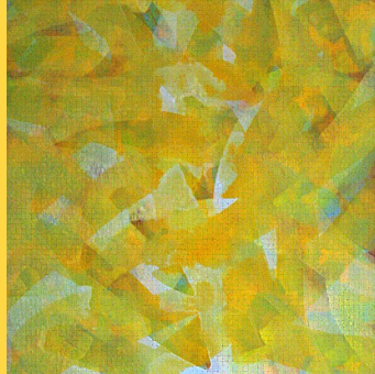
© Rue Hermel 12, 1995 ©VG Bild