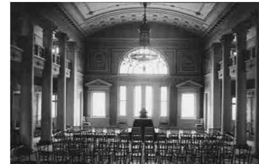
Kirchsaal im Kurhaus zur Zeit Christoph Blumhardts und heute

Lassen Sie sich anstecken von einem visionären Denken und Leben – in einer Zeit, in der wir im Sozialen und im Ökologischen, aber auch in den internationalen Zusammenhängen dringend einen Fortschritt benötigen.