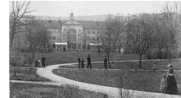
Kurhaus mit Kurpark 1890er Jahre – Kurhaus heute

Anmeldung unter: www.ev-akademie-boll.de/akademie.html Teilnahme inkl. Mittagessen: 28 Euro