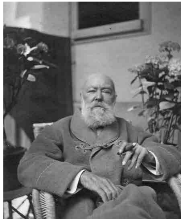
Christoph Blumhardt im letzten Lebensjahr auf der Veranda der Villa Wieseneck

Anmeldung unter: www.ev-akademie-boll.de/akademie.html Teilnahme inkl. Buffet und Aperitif: 22 Euro