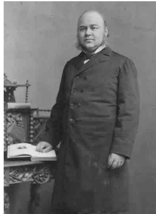
Christoph Blumhardt als Inspektor im Kurhaus, vor 1880