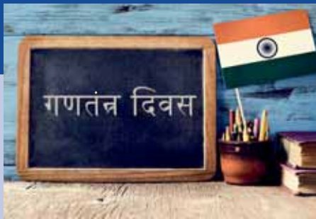
Republic Day of India in Hindi

29. September bis 1. Oktober 2017 Evangelische Akademie Bad Boll